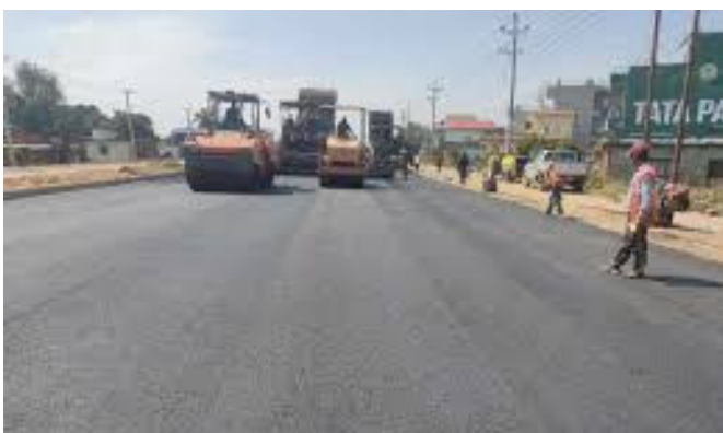
गरी छवटा मोटरबल पुल निर्माण सम्पन्न गरेको थियो। यसैगरी, गत आवमा २६ दशमलव ७३ किमि सडक कालोपत्रे, २७ दशमलव ५८ किमि सडक घामले, १७ दशमलव पाँच किमि सडक मर्मत, तीन किमि कच्ची