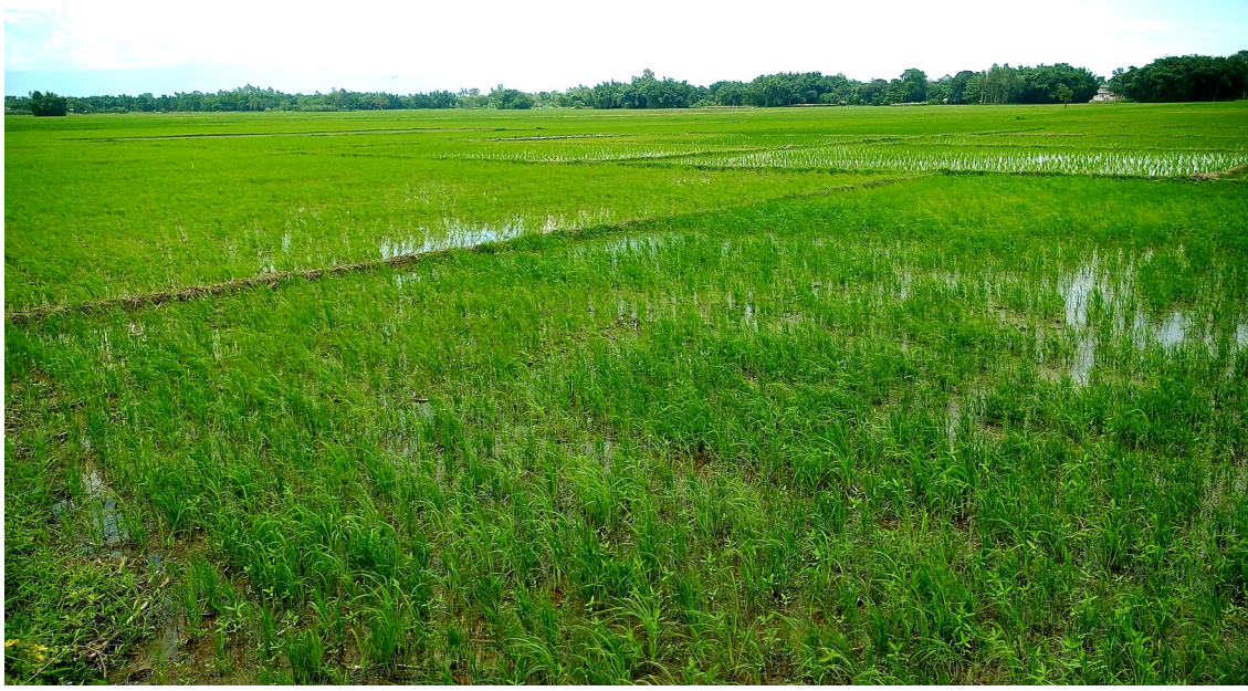
धान खेती : सुनसरीको इनस्वा-२ मा किसानले रोपेर हुँदै गरेको धान खेतीको हरियाली ।