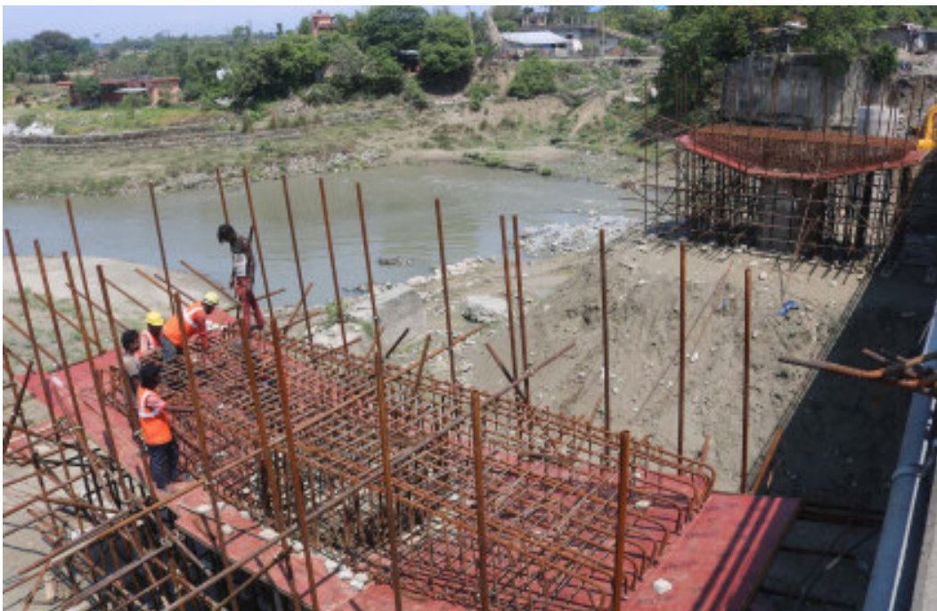
निर्माणाधीन पुलमा काम गर्दै मजदुर : सुनसरी-मोरङको सीमाना जोड्ने दुहवीस्थित बुढी नदीमाथि निर्माणाधीन पुलमा काम गर्दै मजदुर।

वर्ष : २५ अङ्क : १४५ पृष्ठ ४ बितामोड वि.सं. २०७७ बैशाख १२ गते शुक्रवार (Friday, April 24, 2020) नेपाल सम्वत् १९४० Web : www.purwanchaldaily.com मूल्य रु. : ५/- भारतमा भा.रु. : ४/-