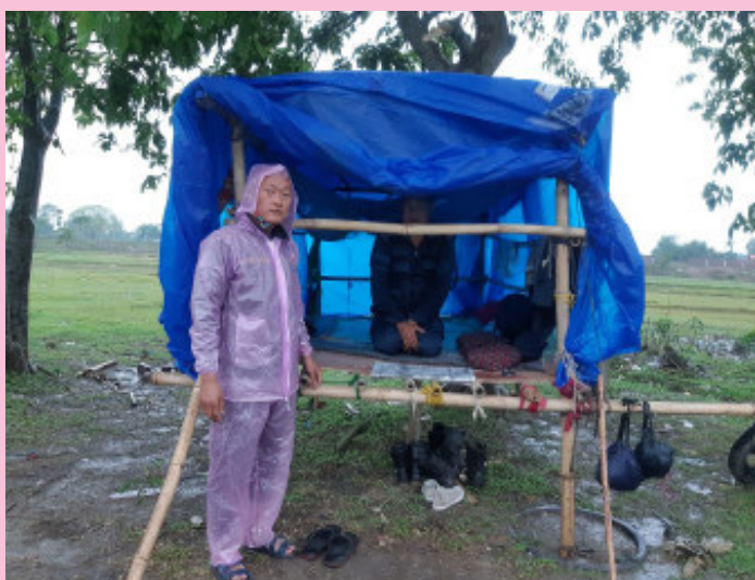
सीमामा तैनाथ छन्।

तर, सीमामा खटिएका सशस्त्र प्रहरी र नेपाल प्रहरीलाई अहिले मौसमले सताइरहेको छ। दैनिकजसो हावाहुरी, चट्याङ, अंसिना पानी पर्न थालेपछि छाप्रो जस्तो अस्थायी प्रहरी पोस्टमा दुखले उनीहरू सीमा सुरक्षा गरिरहेका छन्। हावाहुरीले पोस्ट उडाउने, बस्ने ठाउँमा पानी पर्ने, चट्याङ पर्ने जस्ता समस्याका बीच उनीहरू देशका जनताका लागि