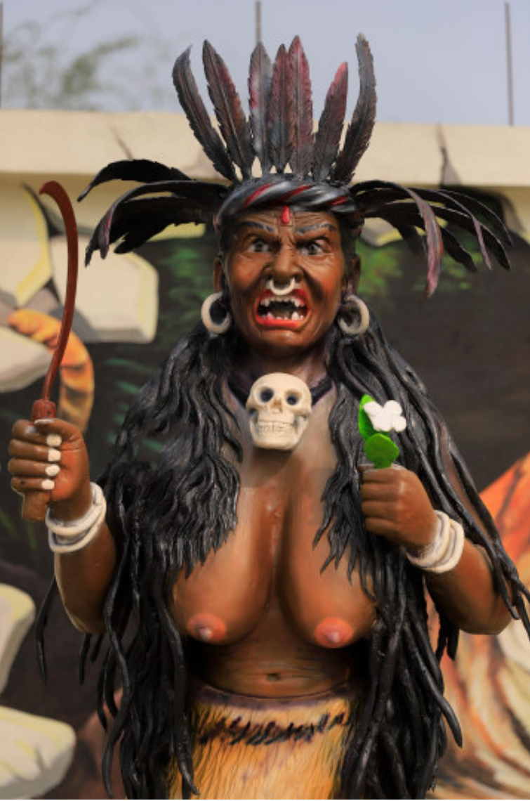
फिलफिलेमा अनौठो प्रतिमा: भ्नापाको फिलफिलेमा रहेको वाटर किड्डम पार्कमा बनाइएको अनौठो आकृति। फोटो हेर्दा डरलाग्दो देखिने यो प्रतिमा पुरानो मानव सभ्यतालाई फल्काउन खोजिएको जस्तो देखिन्छ। यस प्रतिमाको शिर तिरको भागलाई हेर्दा धामी (भाँकी) जस्तो लाग्छ तर खुट्टालाई हेर्दा भूतप्रेत यो हो कि भन्ने अनुमान त्यहाँ पुग्नेहरूले गर्ने गरेका छन्।