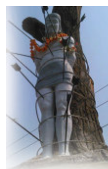
उद्योगी नीतिगतले चर्चा गर्ने... समावेशीकरणको यात्रामा एउटा अभियान...