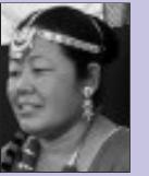
सगले चर्चा गर्ने