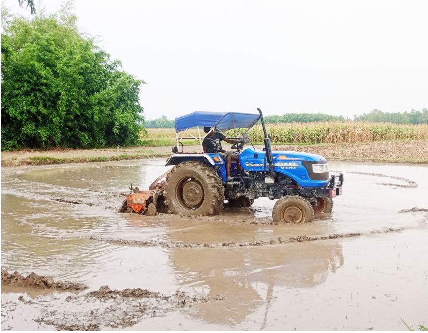
धानको बीउ राख्ने तयारी: सुनसरीको इनरुवामा धानको बीउ राख्न ट्याक्टरले खेत सम्पाउँदै किसान । नहरमा पानी नछार्नेवाट बीउ छन एक साता ढिलो भएको किसान बताउँछन् । रासस