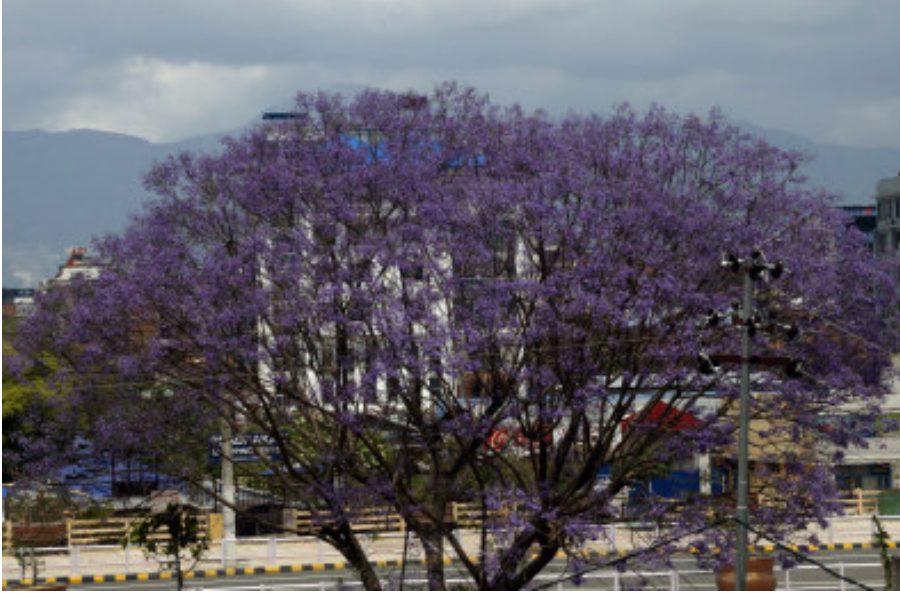
ढकमढक फुलेको ग्याकाराण्डा: काठमाडौंको भद्रकाली-सिंहदरबार पुल किनारमा ढकमढक फुलेको ग्याकाराण्डा फूल।

वर्ष : २५ अङ्क : १५१ पृष्ठ ४ वितामोड वि.सं. २०७७ बैशाख १८ गते बिहीवार (Thursday, April 30, 2020) नेपाल सम्बत् १९४० Web : www.purwanchaldaily.com मूल्य रु. : ५/- भारतमा भा.रु. : ४/-