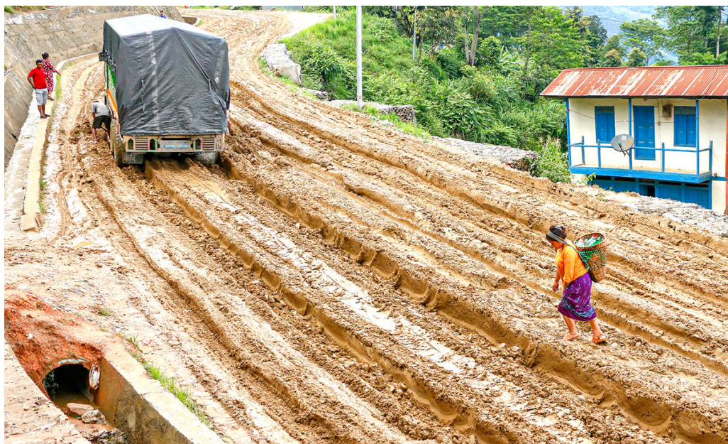
हिलाम्मे सडक : कोशी राजमार्ग अन्तर्गत संखुवासभाको खाँदवारी नगरपालिकाको लबिङ हिल-मानेभञ्ज्याङ सडकखण्ड वर्षाले हिलाम्मे भएपछि सडकमा फसेको ट्रक तथा बाटो पार गर्दै स्थानीय महिला। ठेकेदारले समयमा सडक कालोपत्रको काम नसक्दा वर्षेनी त्यहाँका स्थानीयले सास्ती खेप्दै आएका छन्।