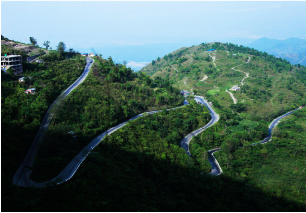
भेडेटारबाट हेर्दा देखिने कोशी राजमार्ग, भेडेटार पूर्वको एक पर्यटकीय गन्तव्य हो।