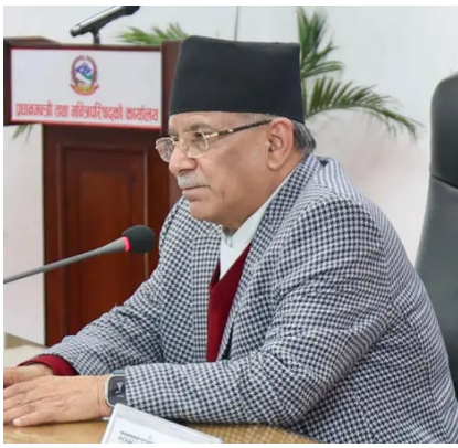
प्रचण्डले विश्वासको मत जाँच लागेका हुन् ।

काठमाडौं, असार २९। प्रधानमन्त्री पुष्पकमल दाहाल 'प्रचण्ड'ले आफ्नो सरकार अल्पमतमा परेसँगै असार २८ गते प्रतिनिधिसभामा विश्वासको मत जाँच गर्ने व्यवस्था गर्न संघीय संसदका महासचिवलाई पत्राचार गरेका छन् । संसदका दुई ठूला दल नेपाली कांग्रेस र नेकपा एमालेले मिलेर सरकार बनाउने सहमति गरेपछि प्रचण्डको सरकार सङ्घट्टामा परेको थियो । दुई दिनअघि मुख्य सत्ता साझेदार एमालेले आफ्नो समर्थन फिर्ता लिएको थियो भने उक्त दलका तर्फबाट सरकारमा सहभागी मन्त्रीहरूले राजीनामा बुझाएका थिए । सरकारमा सहभागी कुनै एक दलले समर्थन फिर्ता लिएको अवस्थामा ३० दिनभित्र विश्वासको मत जाँचपुनर् सवैधानिक व्यवस्था छ । प्रचण्ड एमालेले साथ छाडेको नौ दिनभित्र उक्त प्रक्रियामा जान लागेका हुन् । कांग्रेसले नयाँ बन्ने सत्ता गठबन्धनमा एमाले अध्यक्ष केपी शर्मा ओलीलाई प्रधानमन्त्री बनाउने केन्द्रीय समितिबाट निर्णय गरिसकेको छ । उनीहरूले सरकार स्पष्ट रूपमा अल्पमतमा रहेकाले राजीनामा दिएर मार्गप्रशस्त गर्न नयाँ समीकरणका दलहरूले अग्रह गरिरहेका