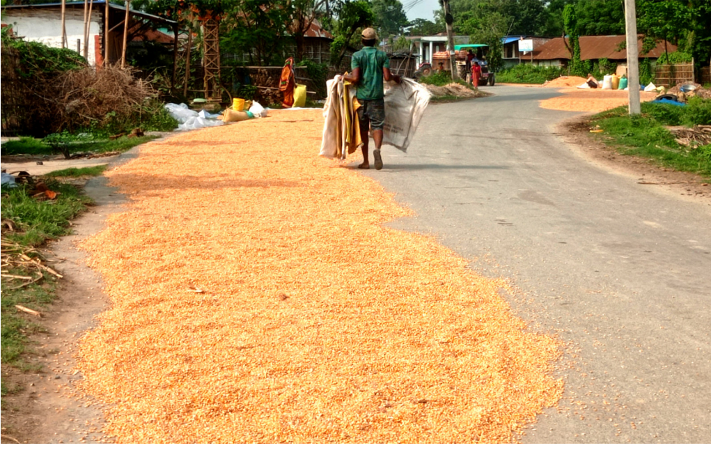
सडकमा बिस्कुन सुकाउँदा दुर्घटनाको जोखिम : सुनसरीको गढी गाउँपालिका-६ सत्तेरभोरामा किसानले सडकमा सुकाएको मकै । सडकमा बिस्कुन सुकाउँदा सवारी दुर्घटनाको जोखिम बढेको छ ।