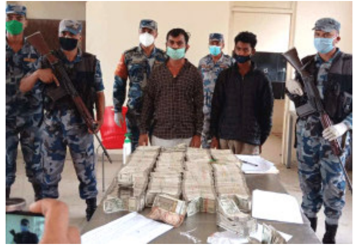
पक्राउ गरिएको उनले बताए। घटनाबारे थप अनुसन्धान गरिरहेको उनले बताए।