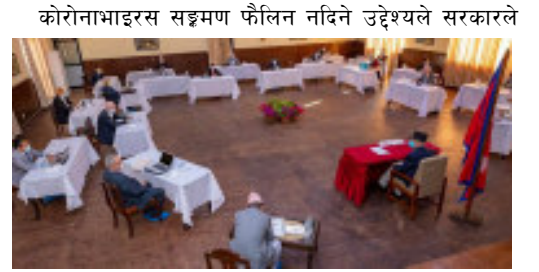
कोरोनाभाइरस सङ्क्रमण फैलिन नदिने उद्देश्यले सरकारले

भापा, वैशाख २४ । सरकारले थप १० दिन देशव्यापी लकडाउन बढाउने निर्णय गरेको छ । बुधवारको मन्त्रिपरिषदको बैठकले जेठ ५ गतेसम्म लकडाउनको अवधि बढाउने निर्णय गरेको हो ।