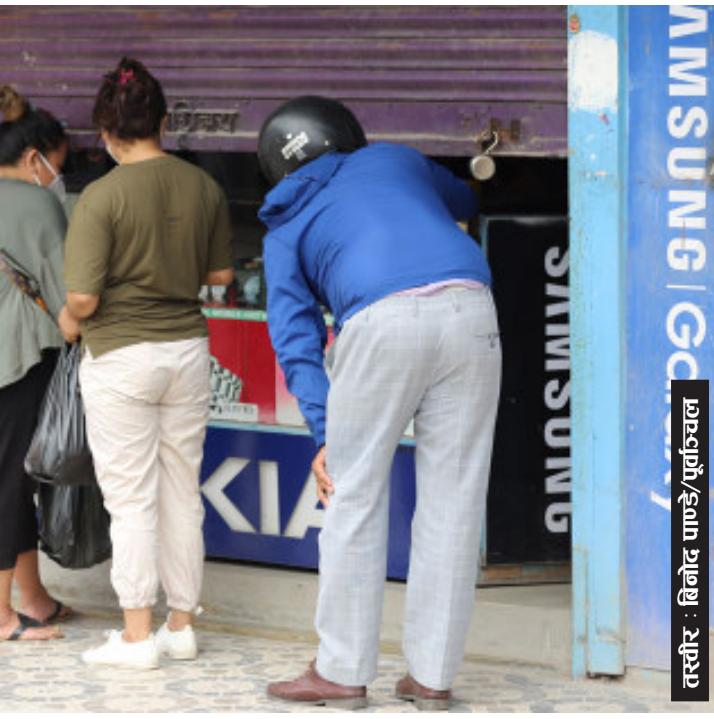
भापाको बिर्तामोडस्थित मुक्तिचोक नजिकै एक इलेक्ट्रिक पसलमा सामान किन्दै ग्राहक। यो दृष्यले लकडाउनलाई आधा पालना गर्दै अर्थतन्त्रमाथि उठाउने प्रयासमा व्यापारी लागीपरेको देखिन्छ।