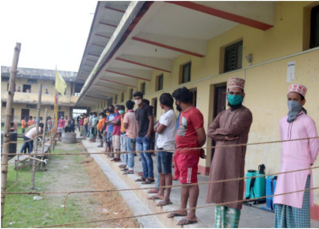
क्वारेन्टिनमा बसेका युवा: कचनकवल गाउँपालिकाको क्वारेन्टाइन्मा बसेका युवा। भारतबाट आई क्वारेन्टिनमा बसेकालाई कोभिड-१९ जाँचमा रिपोर्ट नेगेटिभ आएपछि मात्र घर पठाइन्छ। कचनकवलमा मात्रै ११३ जनामा कोरोना सङ्क्रमित भएको पाइएको छ।