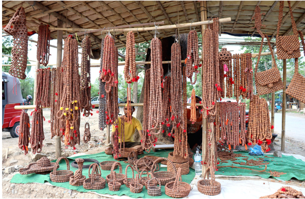
रुद्राक्ष मालाको व्यापार : धरान उपमहानगरपालिका-१४ स्थित पिण्डेश्वरी मन्दिर परिसरमा बेच राखिएका रुद्राक्षको माला ।