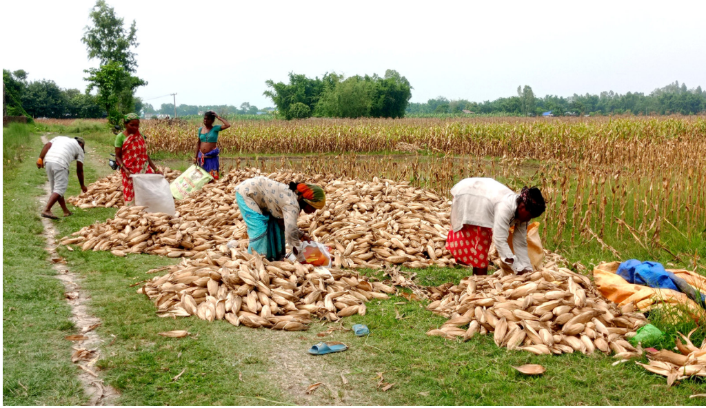
मकै घर लैजाणे तयारी : सुनसरीको इनरुवाका किसान भौंचेको मकै घर लैजाणे तयारी गर्दै ।