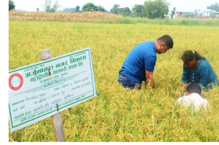
वर्षको लागि एक लाख ५० हजार केजी उन्नत र ५० हजार प्रमाणित बीज उत्पादन हुने विश्वास लिएका छौं । -उनले भने । अध्यक्ष रानाका अनुसार बीज वृद्धि कार्यक्रमको लागि सहयोगी संस्थाहरू अर्जुनधारा नगरपालिका

कार्यक्रमको लागि धान बाली कटाई अघिको निरीक्षण गर्ने उद्देश्यले उक्त कार्यक्रमको आयोजना गरिएको अध्यक्ष रानाले बताए । 'अहिलेसम्मको अवस्थामा सबै बाली राम्रो भएको हुँदा आगामी