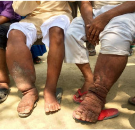
चैत ३० गतेदेखि हात्तीपाइलेविरुद्धको आमऔषधि सेवन कार्यक्रम

भापा, चैत ३। सरकारले हात्तीपाइले रोग निवारणमा विशेष कार्यक्रम सञ्चालन गरे पनि भापामा अझै हात्ती पाइले रोगीको संख्या चार सयभन्दा बढी रहेको पाइएको छ।