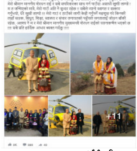
(बाँकी अन्तिम पृष्ठमा)

हेलिकप्टरका साथ मुख्यमन्त्री दम्पितले खिचेका फोटो