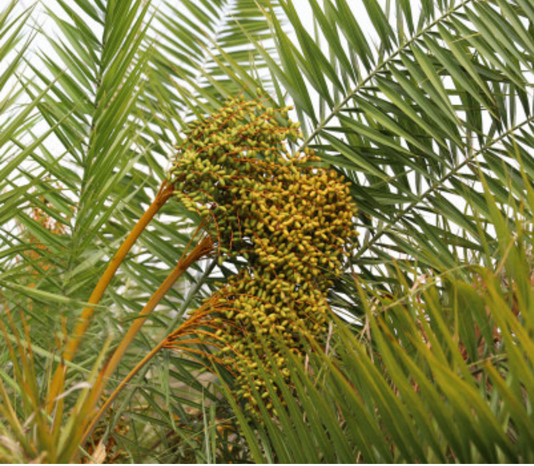
इलाम जिल्लाको माई नगरपालिकाको चेप्टी जंगलमा फलेको थाकल। गर्मीयाममा चुरे क्षेत्रमा पाइने खजुर प्रजातिको फल हो थाकल। पोथ्रे आकारमा रूखो सुख्खा ठाउँमा पाइने थाकलको पातबाट घरको छानो, टाटीबेरा, ओछ्याउने चट्टी, डाली लगायतका सामग्री बनाउन पनि प्रयोग गर्ने गरिन्छ।

वर्ष : २५ अङ्क : १७० पृष्ठ ४ बिर्तामोड वि.सं. २०७७ जेठ ६ गते मंगलवार (Tuesday, May 19, 2020) नेपाल सम्बत् १९४० Web : www.purwanchaldaily.com मूल्य रु. ५/- भारतमा भार. : ४/-