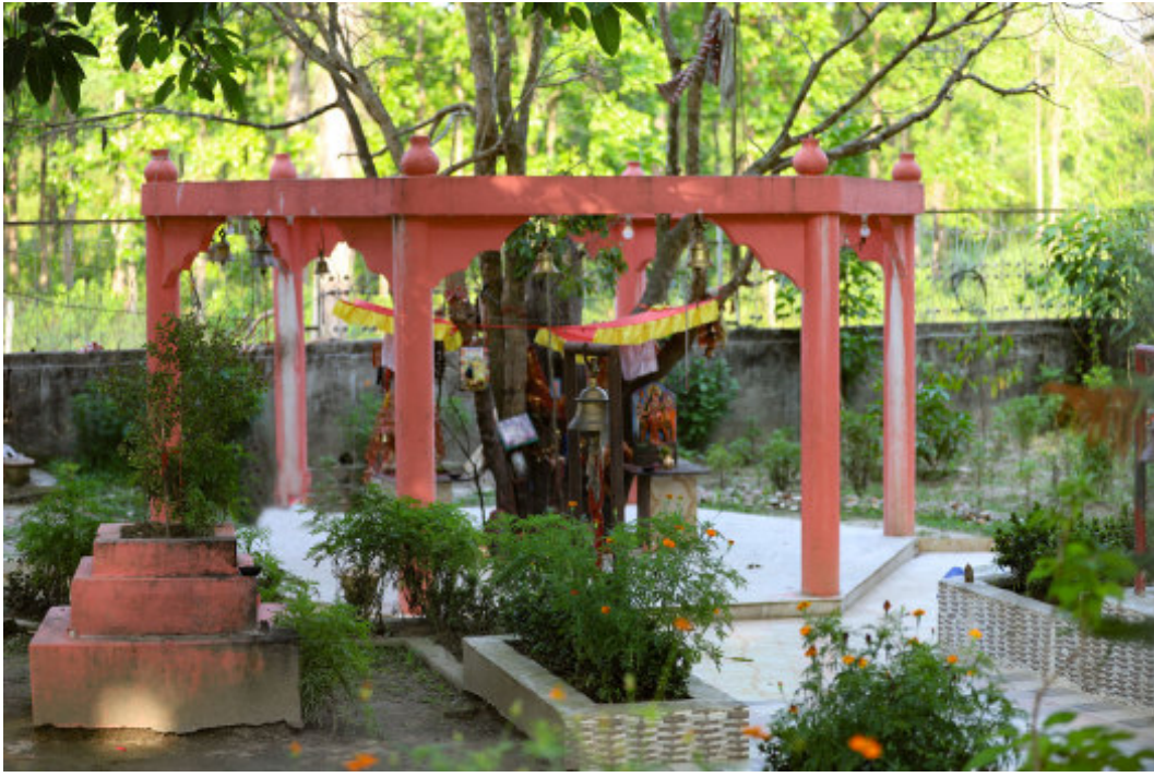
आस्थाको केन्द्र भुल्के जाल्या देवी: मोरङको पथरीशान्चरे नगरपालिका-१मा रहेको भुल्के जाल्या देवी मन्दिर। पथरी बजारबाट पाँचसय मिटर उत्तरमा रहेको यस मन्दिर जंगलको बीचमा रहेको छ। जमिनबाट निरन्तर पानीको भुल्का निस्किरहने ठाउँ भएकाले देवीयानको नाम भुल्के जाल्या देवी राखिएको स्थानीयहरू बताउँछन्।