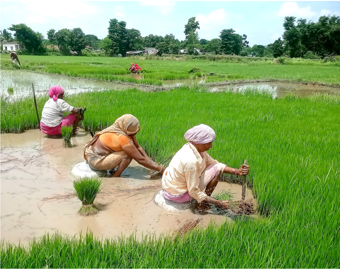
धानको बीऊ काट्दै किसान | सुनसरीको इनरुवा-८ मा धानको बीऊ काट्दै किसान । अविरल वर्षापछि हुवान भएको खेतमा यतिबेला किसानलाई धान रोप्न धमाधम छ ।