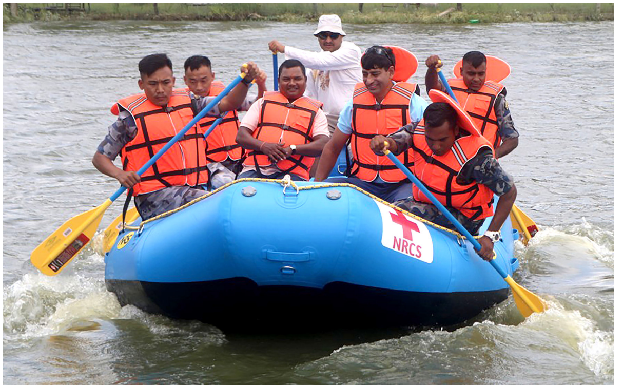
नेपाल रेडक्रेस सोसाइटी मोरङद्वारा विपद् प्रतिकार्यका लागि मोरङको जहदा गाउँपालिका र सशस्त्र प्रहरी ३ नं. हेक्टवार्डर बुढीगंगा गाउँपालिका टडी सिनवारोलाई हस्तान्तरण गरिएको 'रबर बोट' सञ्चालन सम्बन्धी पालिकाका कर्मचारीलाई कटहरी गाउँपालिकाको गोपाल फनपाकंमा तालिम दिँदै सशस्त्र प्रहरी ।