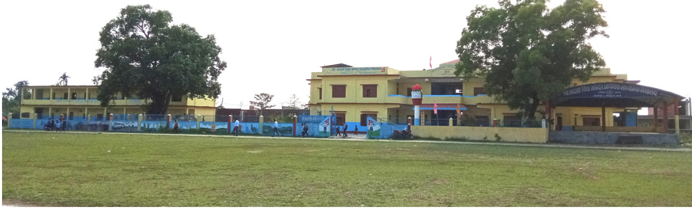
प्राथमिक शिक्षामा आकर्षण : भ्रमणको घैलाडुवा रहेको आदर्श विद्या मन्दिर माध्यमिक विद्यालय, यस विद्यालयमा कक्षा ९ देखि १२ सम्म सिभिल इन्जिनियर पढाई हुँदै आएको छ । यो भ्रमणको पुरानो विद्यालय हो ।

सुरुङ्गा, जेठ ७ । सुरुङ्गामा वार्संग बालबालिका कार्यक्रम हुने भएको छ । भ्रमण जिल्ला बाल सञ्जालको आयोजना, कनकाई नगरपालिकाको मुख्य आर्थिक सहयोग, भ्रमणका सम्पूर्ण पालिकाको सहयोग, आई.वाई. डायनामिक इन्टरनेशनलको समन्वयमा हुने कार्यक्रममा स्थानीय बाल सञ्जालको समन्वयमा १४ पालिका हरेकबाट प्रतिनिधिमूलक ३० बालबालिका र कनकाई नगरपालिकाबाट थप गरी जम्मा छ सयको सहभागिता रहने छ ।