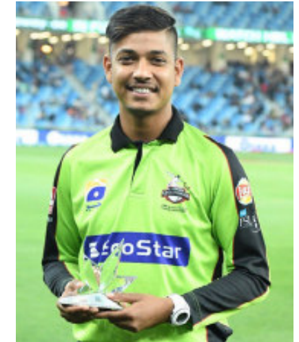
सन् २०१८ मा पहिलोपटक आईपीएलमा सहभागिता जनाएसँगै विश्वभरका क्रिकेट लिगमा सन्दीपका लागि ढोका खुलेको थियो । उनले उत्कृष्ट

आईपीएलका तीन वर्षहरूमा सन्दीपले जम्मा नौ खेल खेले र, १३ विकेट लिए । २०१८ को आईपीएलमा तीन खेलमा मात्रै मौका पाएका सन्दीपले २०१९ मा छ वटा खेल खेले । दिल्ली क्यापिटल्सको वेभसाइटका अनुसार २०१८ मा सन्दीपले तीन खेलबाट पाँच र २०१९ मा छ खेलबाट आठ विकेट हात पारेका थिए ।