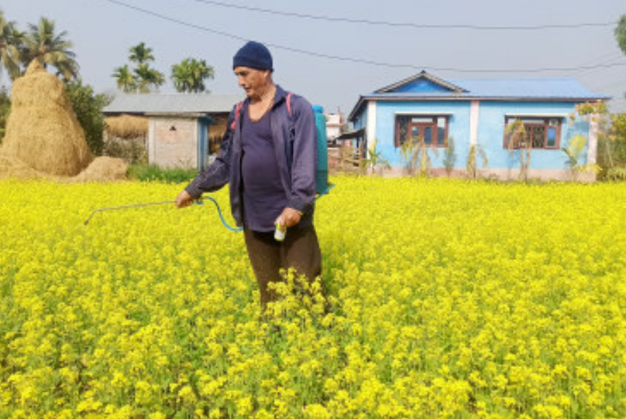
भापाको शिवसताक्षीमा बाक्लो हुस्सु लाग्न थालेपछि बालीको संरक्षण गर्न कीटनाशक औषधि छर्दै किसान।

वर्ष : २६ अङ्क : २९ पृष्ठ ४ वित्तमोड वि.सं. २०७७ पुस १ गते बुधवार (Wednesday, December 16, 2020) नेपाल सम्बत् १९४१ Web : www.purwanchaldaily.com मूल्य रु. : ५/- भारतमा भाडु. : ४/-