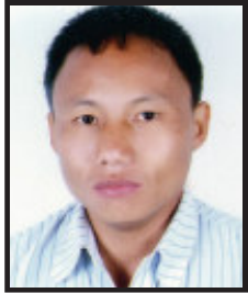
कुकु गणनीयताको दृष्टि