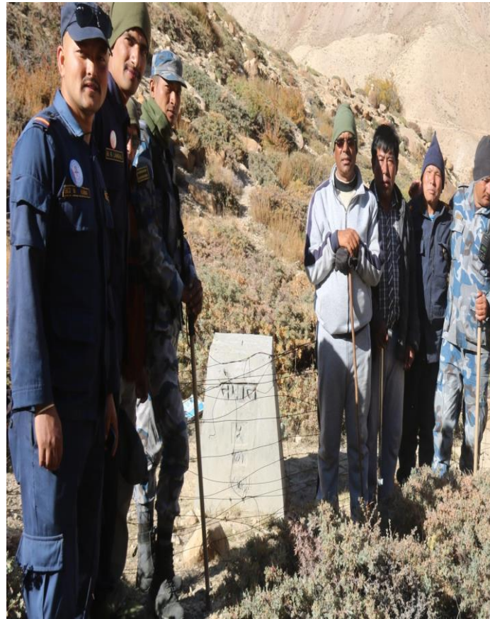
५ (२) नं सिमा स्तम्भ