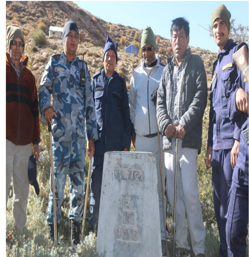
५ (१) नं सिमा स्तम्भ