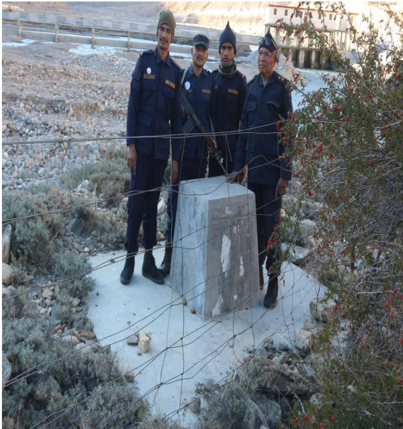
६ (१) नं सिमा स्तम्भ