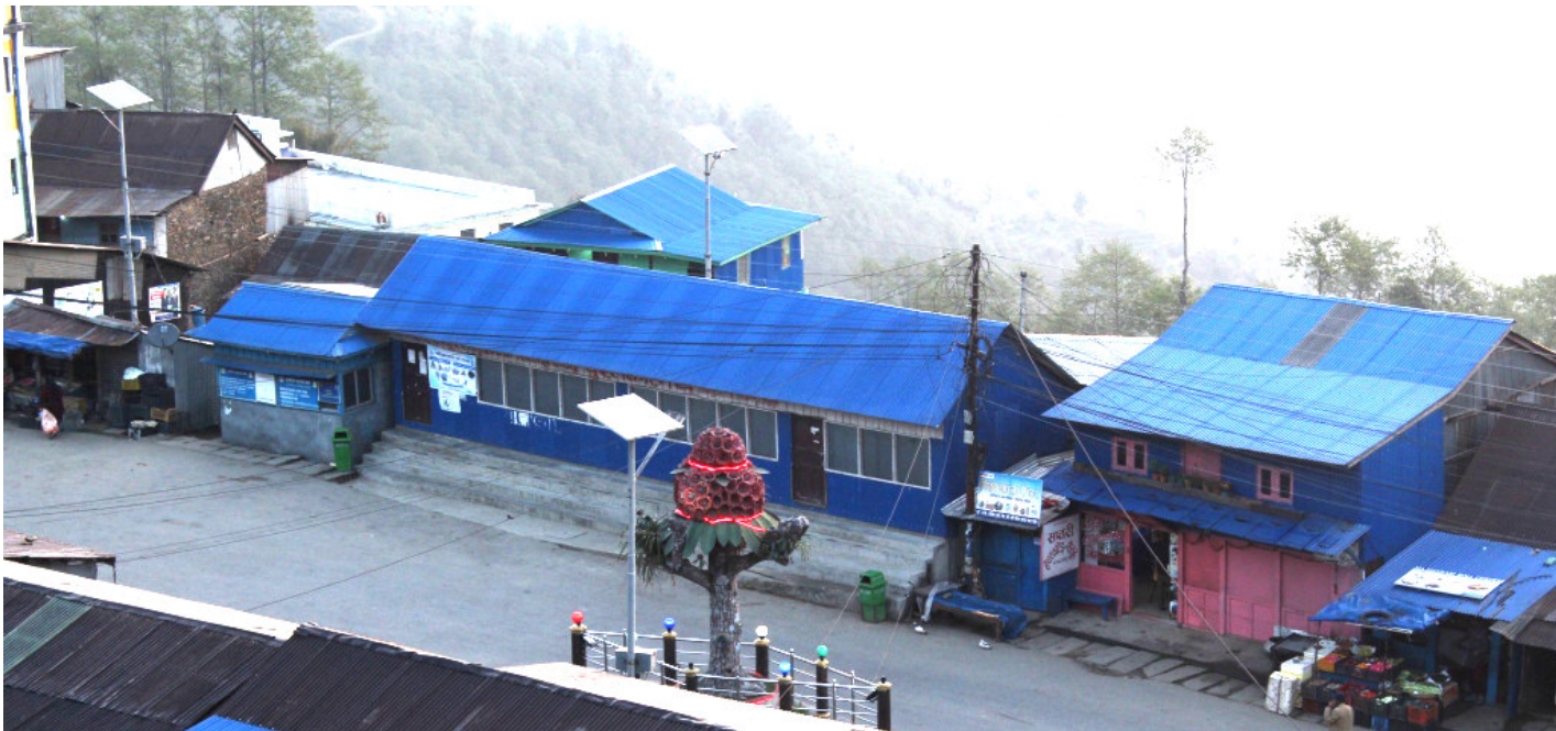
लालीगुराँसको प्रतिरूप : तेह्रथुमको लालीगुराँस नगरपालिका-२ स्थित बसन्तपुर बजारमा रहेको राष्ट्रिय फूल लालीगुराँसको प्रतिरूप । त्यस क्षेत्रको लागि आकर्षणको केन्द्र बन्न पुगेको उक्त लालीगुराँसको प्रतिरूप अगाडि आन्तरिक तथा बाह्य पर्यटकहरू तस्वीर खिच्न लालायित देखिन्छन् ।